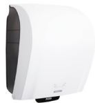
40735 Katrin Plastic Dispenser Extra Large For System Paper Towel Roll, White