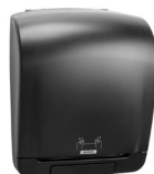
92025 Katrin Plastic Dispenser For System Paper Towel Roll, Black