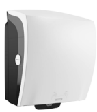
82094 Katrin Plastic Dispenser For System Paper Towel Roll, White