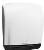
90045 Katrin Plastic Dispenser For System Paper Towel Roll, White