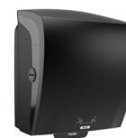
82070 Katrin Plastic Dispenser For System Paper Towel Roll, Black