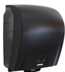
40711 Katrin Plastic Dispenser Extra Large For System Paper Towel Roll, Black

Medzinárodná ponuka, dostupnosť produktu pre SK nájdete na stránke.